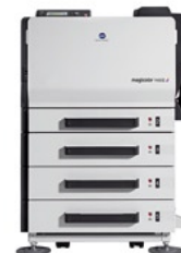
magicolor 7450II GA с дуплексом, 3 нижними лотками и установочным основанием