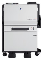
magicolor 7450II GA с дуплексом и установочной тумбой