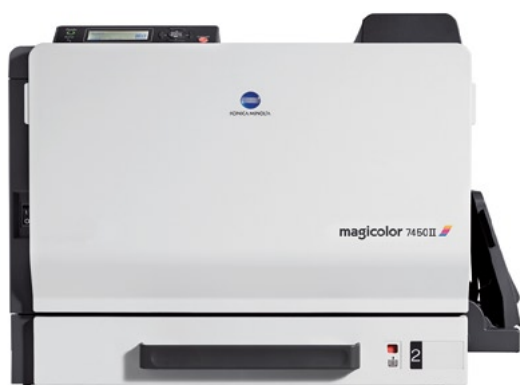
magicolor 7450II GA

Вам, как профессионалу в области полиграфии и графики, очень важно добиваться превосходного качества и цветопередачи! Если вы работаете художником, дизайнером, в рекламном агентстве или дизайн-студии, вы серьезно относитесь к качеству цветной печати, поскольку постоянно используете цвет в своей деятельности. magicolor 7450II GA от Konica Minolta — это цветной высокопроизводительный принтер формата A3+, созданный специально для работы в творческих коллективах.