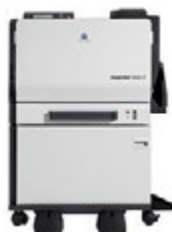
magicolor 7450II с дуплексом и установочной тумбой