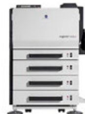
magicolor 7450II с дуплексом, 3 нижними лотками и установочным основанием